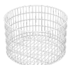
01 Cesto universal inoxidável para até 24 copos.