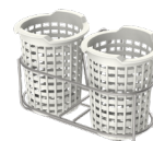
01 Suporte inoxidável para até 30 talheres em pé.